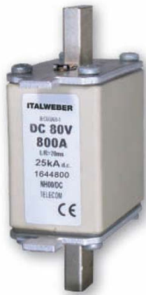
Immagine del prodotto / Product image